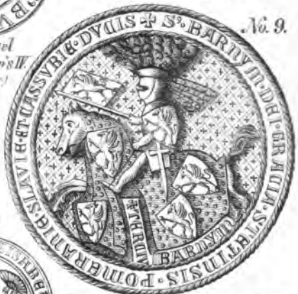
Reiter-Siegel Barnim's III. v. Pom. Stettin v. J. 1333. (9 Cm. im D.)