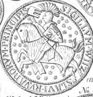
Wizlaw's II. Reiter- und Schild-S. als Rück-S. No. 32. (1284)