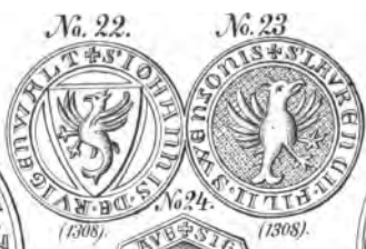
S. der Söhne des Palatins Smeren, als Herren von Slawe u. Rügenmalde.