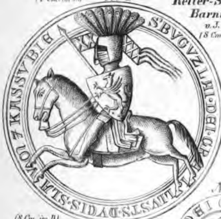
Reiter-Siegel Herz. Bogislaw's IV. v. Pom. Wolgast v. J. 1278. (8 Cm. im D.)