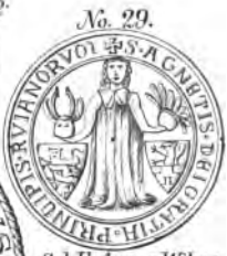
S. d. F. Agnes, Witwe Wizlaw's II. (1302). No. 29.