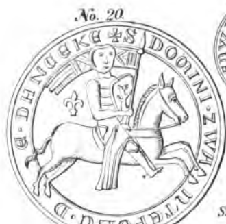
Reiter-S. Swantepolks (1220-66). von Ost-Pommern.