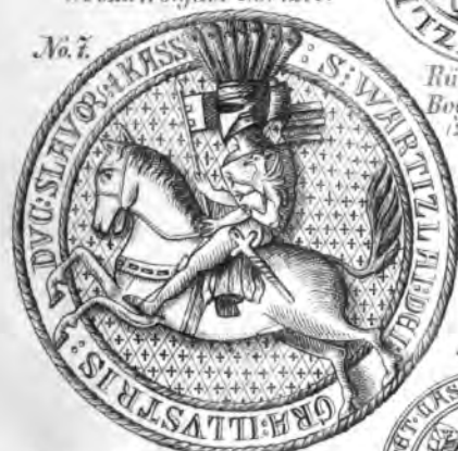
Reiter-Siegel Wartislaw's II. v. Pom. Wolgast v. J. 1309. (8 Cm. im D.)