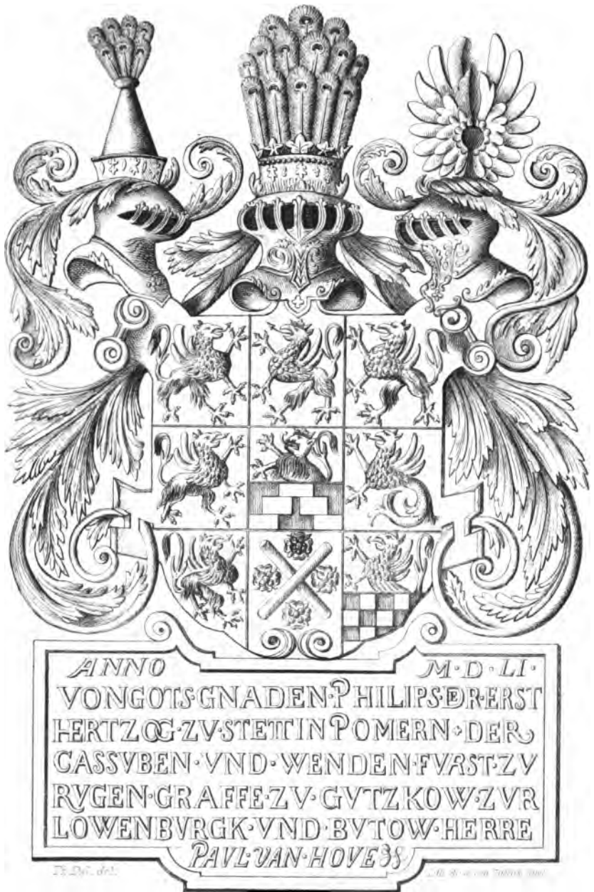
Wappen des Herzogs Philipp I. von Pommern aus dem herzoglichen Schlosse zu Wolgast, v. J. 1551, seit d. J. 1803 im Universitätsgebäude zu Greifswald.