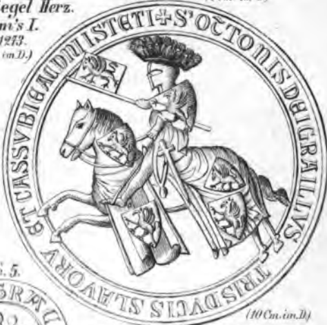
Reiter-Siegel Herz. Otto's I. v. Pom. Stettin v. J. 1302. (10 Cm. im D.)